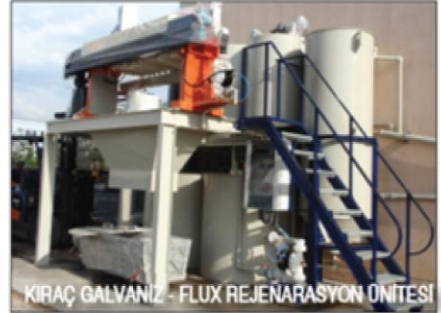
KIRIÇ GALVANİZ - FLUX REJENARASYON ÜNİTESİ

EST Halat Endüstriyel Sapan Teknolojileri Sanayi ve Ticaret A.Ş., uluslararası adı "webbing sling" olan ürünlerin üretimine başladı. Bu halatların bir cinsini üretiminde kullanan Eksaş AŞ, karşılaştığı kalite ve tedarik sorunları nedeniyle uluslararası kalitede üretim yapacak bu şirketin kuruluşunu gerçekleştirmiştir. Ürünlerimiz test edilmekte ve kaliteleri tescil edilmektedir.