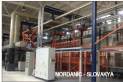
NORDANIC - SLOVAKYA

Endüstriyel Mühendislik Sanayi Ticaret Ltd. şirketini faaliyete geçirmiştir. Eksaş A.Ş. - EST Ltd., uzay endüstrisi tedarikçisi olarak çalışan yerli kurumlarımıza AeroSpace standartlarına uygun tesisler kurarak, Lockheed,