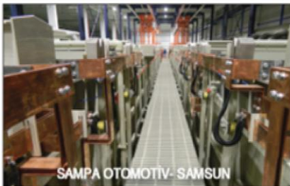
SAMPA OTOMOTIV- SAMSUN

Bu yıl teslim edilen tesislerimiz arasında Sampa Otomotiv A.Ş.-Samsun ( www.sampa.com.tr ), Psomopoulos-Yunanistan ( www.passionfasion.gr ), Nordanic-Slovakya ( www.nordanic.com ), Sofia Med-Bulgaria ( www.sofiamed.bg ) bulunmaktadır.