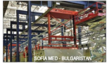
SOFIA MED - BULGARISTAN

Estgal Sıcak Galvaniz Teknolojileri A.Ş., Bursa'da sıcak galvaniz tesisleri kurulumu konusunda faaliyet göstermektedir. Sıcak galvaniz tesislerini, mühendislik hizmetleri dahil olmak üzere "anahtar teslim" bazında üretmekteyiz. Halen ŞA-RA Galvaniz (Adana) ve Konkap A.Ş. (Konya) firmalarına anahtar teslimi tesislerin yapımı devam etmektedir. Fırın ve pota üretimi dışında arazi yerleşiminden tesislerin bütün sorumluluğu Estgal A.Ş. firmamıza aittir.